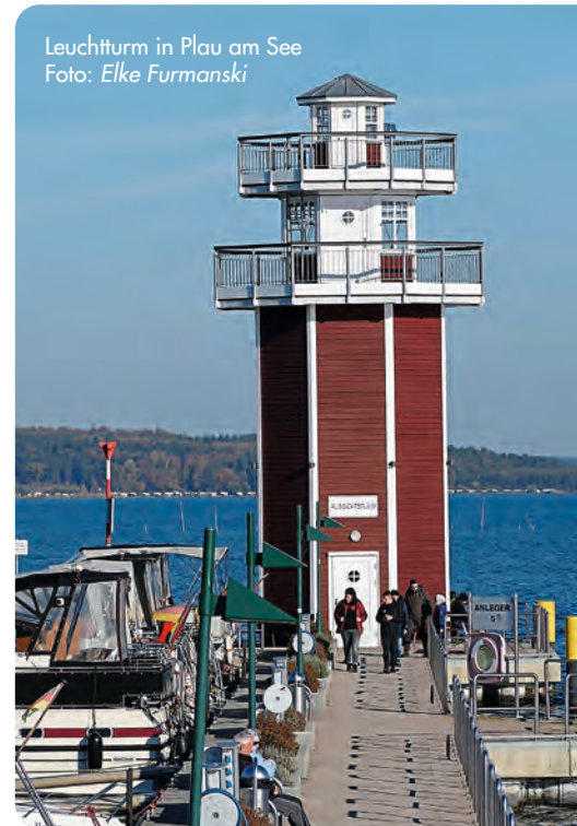
Leuchtturm in Plau am See