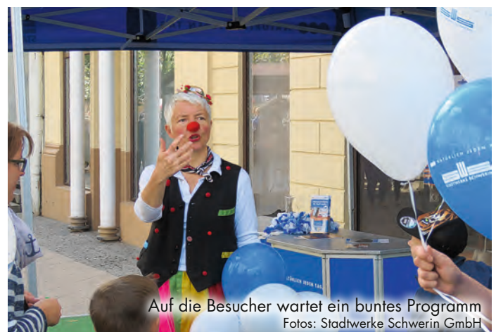
Auf die Besucher wartet ein buntes Programm

Traditionell findet vom 6.–8. September 2019 wieder eines der größten Feste in Schwerin statt: Das Altstadtfest. Auch in 2019 zieht sich die bunte Flanier- und Bummelmeile durch die Schweriner Innenstadt. Händler, Schausteller und Gastronomen sorgen auf der Festmeile rund um den Pfaffenteich für unterhaltsame Vielfalt. Rummel, Markttreiben, internationale Speisen und Getränke, Kinderprogramm – und auch die Stadtwerke sind natürlich wieder dabei. Im und vor dem Kundencenter in der Mecklenburgstraße warten auf die Besucher viele Überraschungen. Wir freuen uns auf ein tolles Festwochenende gemeinsam mit Ihnen.