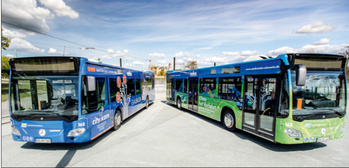
Die neuen Busse mit den Motiven city.kom und Klimaengagement der Stadtwerke sind echte Hingucker