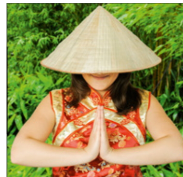
Mit Sommer-Wellness-Woche und Power-Eis-Massage in andere Welten versetzt

Spezialitäten und kleinen Überraschungen unternommen wird. Die erste diesjährige Sommer-Wellness-Woche findet vom 19. bis 25. Juni statt und führt nach Asien . Ein Highlight wird der Saunaabend zur Sommersonnenwende am 21. Juni von 19 bis 22 Uhr mit Wildkräuter-Peeling, Druidenbad, nordischen Saunaaufgüssen und Johannisfeuer. Vorfreude auf den Sommer bringt im Juni eine 20-minütige Power-Eis-Massage mit Aromaöl zum Vorzugspreis von 25 Euro. Die kühlende Wirkung von zerstoßenem Eis aktiviert den Kreislauf und regt die Durchblutung an. Terminvereinbarung für dieses „Wellnessangebot des Monats“ bitte telefonisch unter (0385) 485 000.